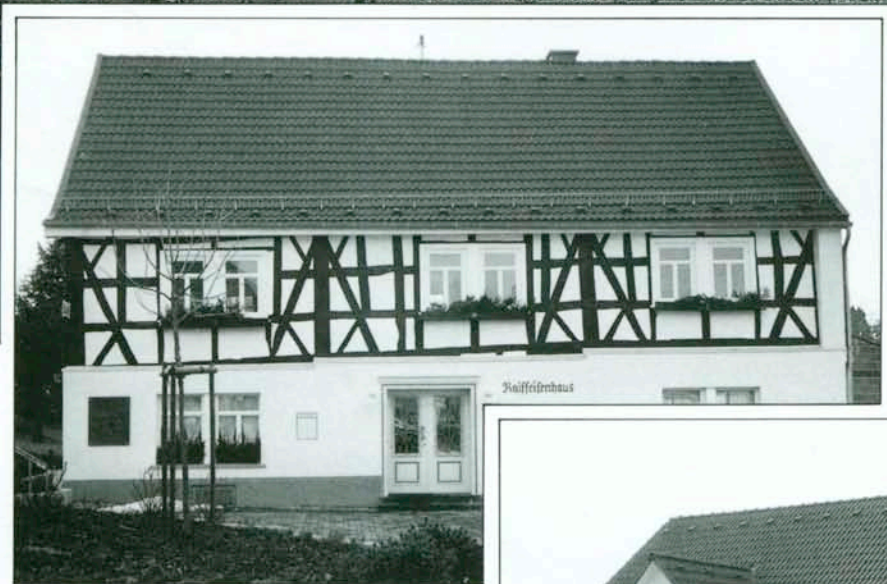
Das völlig restaurierte Raiffeisen-Bürgermeisterhaus Erdgeschoß: Bankfiliale Obergeschoß: Raiffeisen-Museum