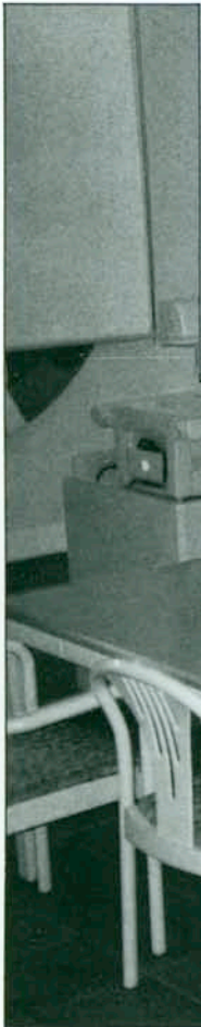
Variante für Raumgestaltungen bei Sitzungen, Seminaren etc.