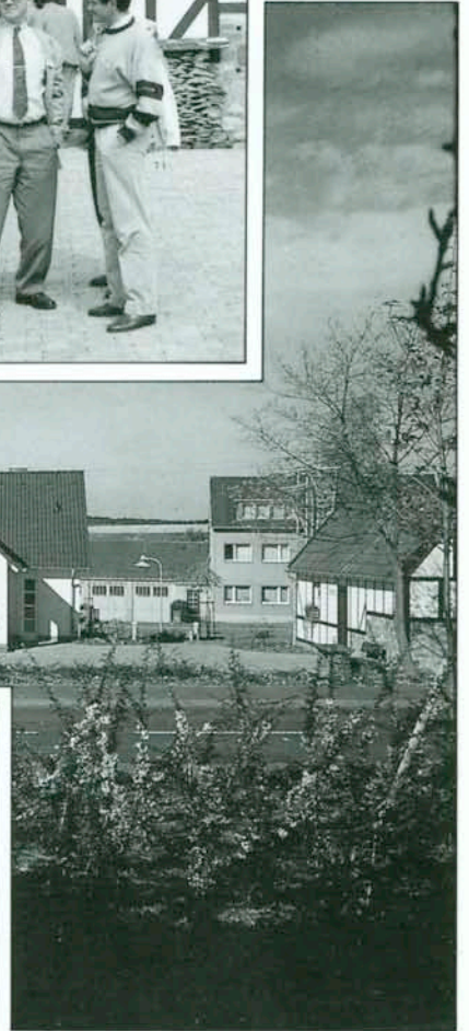
Internationales Raiffeisen-Begegnungs-Zentrum, erbaut August 1989