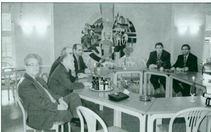
Sitzung eines Bankleiterkreises im RBZ. Hintergrund: Kunstwerk aus Glaskeramik mit den einzelnen Stationen F. W. Raiffeisens

W E Y E R B U S C H F.W. Raiffeisen gründete hier 1847 den Weyerbucher Brotverein, die „Urzelle“ des Genossenschaftsgedankens „Hilfe zur Selbsthilfe“