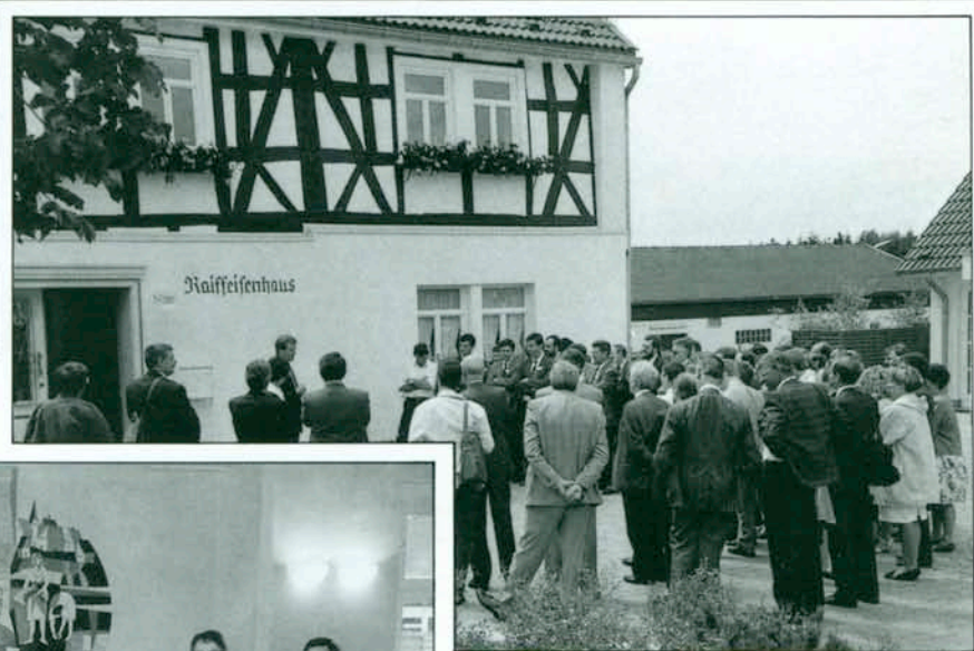
Große ausländische Besuchergruppe zur Besichtigung des Raiffeisen-Bürgermeisterhauses und Raiffeisen-Begegnungs-Zentrums mit historischem Vortrag