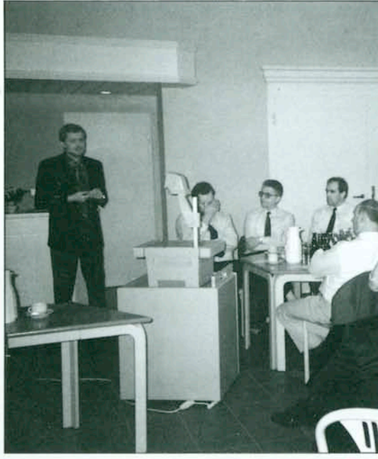
Seminar im Raiffeisen-Begegnungs-Zentrum (techn. Einrichtungen: Overhead-Projektor, Flip-Chart)